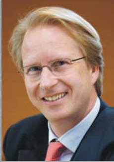
Roland Koch Ministerpräsident des Landes Hessen

„In wirtschaftlich schwierigen Zeiten gilt es, Risikobereitschaft und Verantwortung zu zeigen. Nur die unternehmerische Energie ist Grundlage für Wachstum und Innovation.“